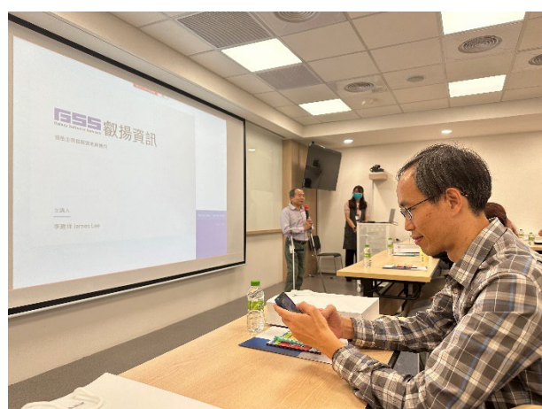
說明：聆聽企業介紹