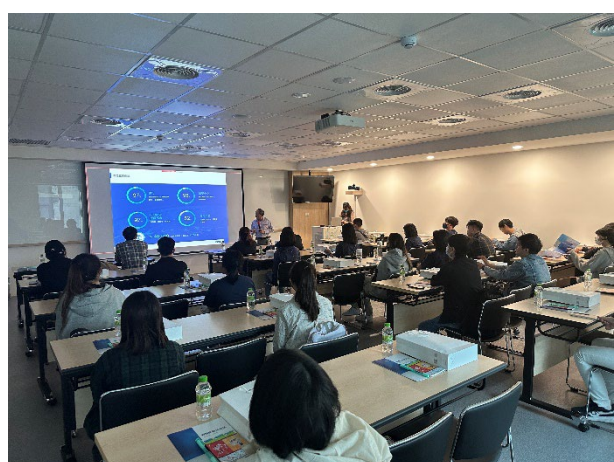
說明：聆聽企業介紹