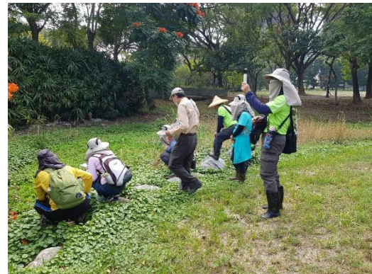
志工服務-蜻蛉調查