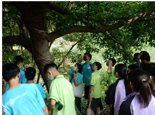
中小學環境教育體驗課 校園膠點